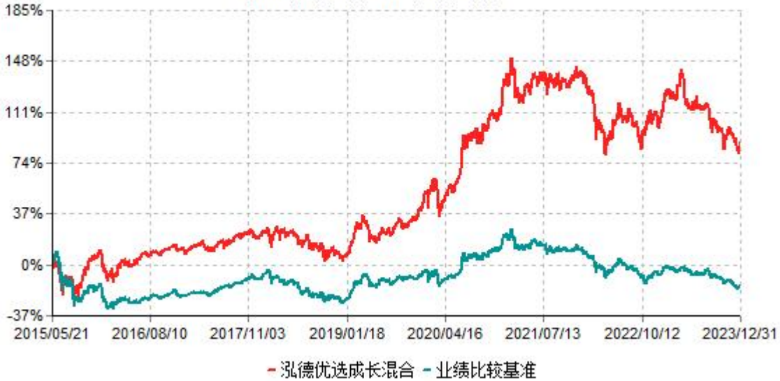
泓德优选成长混合型证券投资基金累计净值增长率与业绩比较基准收益率历史走势对比图 (2015年05月21日-2023年12月31日)

注：根据基金合同的约定，本基金建仓期为6个月，截至报告期末，本基金的各项投资比例符合基金合同关于投资范围及投资限制规定。