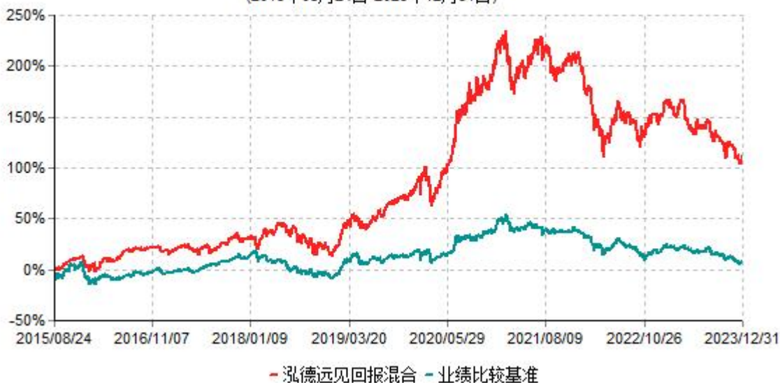
泓德远见回报混合型证券投资基金累计净值增长率与业绩比较基准收益率历史走势对比图 (2015年08月24日-2023年12月31日)

注：根据基金合同的约定，本基金建仓期为6个月，截至报告期末，本基金的各项投资比例符合基金合同关于投资范围及投资限制规定。